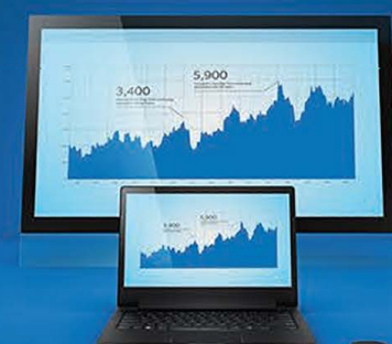
Intel® Wireless Docking