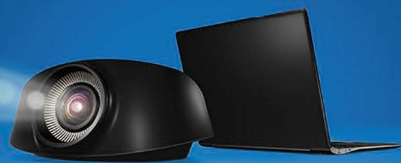
Intel® Pro Wireless Display