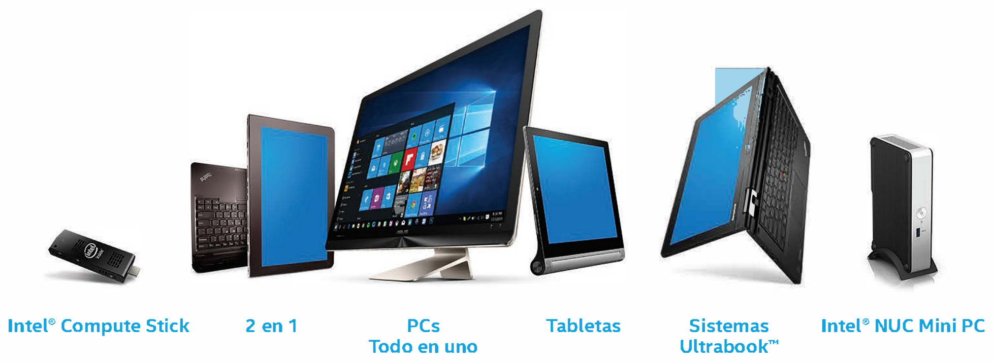
Intel® Compute Stick

El dispositivo correcto en el momento correcto | Más opciones